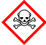
GHS06 Dödskalle med korsande benknötar