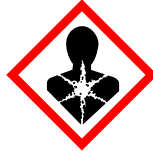
GHS08 Pericolo per la salute