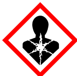
GHS08 Zagrożenie dla zdrowia